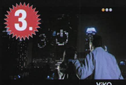
Reklamveren : Viko Reklam Ajansı : C4 Safari