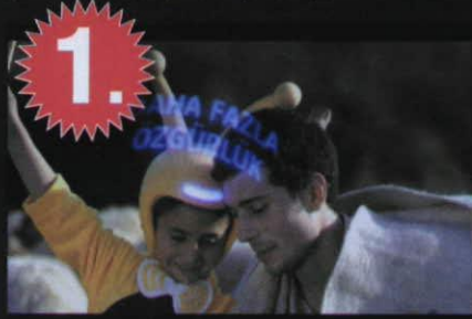
Reklamveren : Turkcell Reklam Ajansı : Leo Burnett

geçirdiği reklam filmi yer alıyor. En beğenilen kampanyalarda Siz de başarılı bulduğunuz kampanyalara oy vererek, kampanya ile ilgili düşüncelerinizi bu sayfa aracılığı ile tüm Türkiye'ye ulaştırabilirsiniz. (www.marketingturkiye.com/yeni/Kampanyalar/YeniKampanyalar)